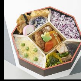
葵(あおい) ¥1,080(税込) 6月~8月の限定販売