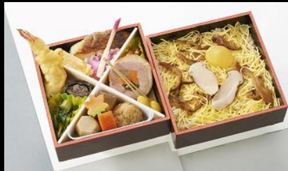
秋のふきよせ ¥1,620(税込) 9月~11月の限定販売