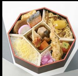
萩(はぎ) ¥1,080(税込) 9月~11月の限定販売