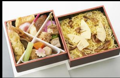
春のふきよせ ¥1,620(税込) 3月~5月の限定販売