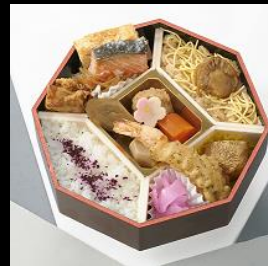
柊(ひいらぎ) ¥1,080(税込) 12月~2月の限定販売