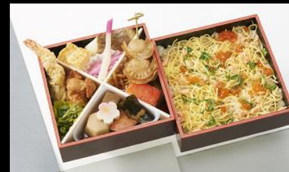
冬のふきよせ ¥1,620(税込) 12月~2月の限定販売