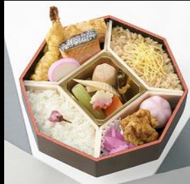
藤(ふじ) ¥1,080(税込) 3月~5月の限定販売