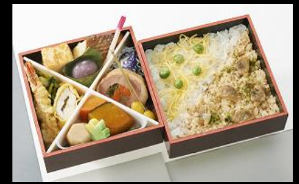
夏のふきよせ ¥1,620(税込) 6月~8月の限定販売