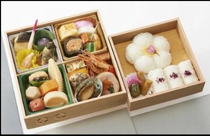
花宴(はなうたげ) ¥4,860(税込)